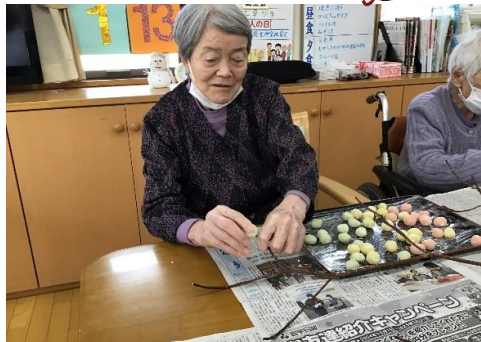
しっかりくっつけないとな