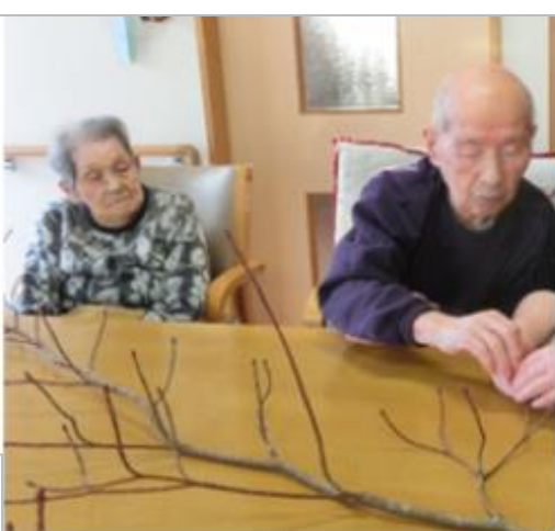
1/12 小正月行事みずき団子づくり