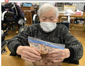
袋の中でモミモミ