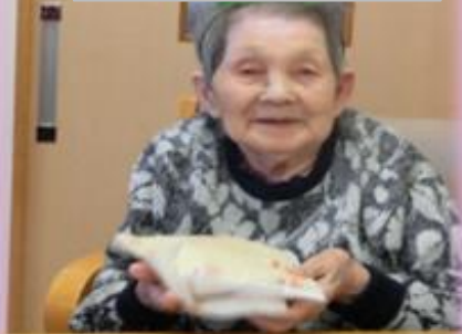
巳年生まれのユキ様