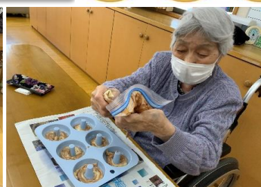
生地を絞り出して