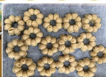
レンジでチンして完成！