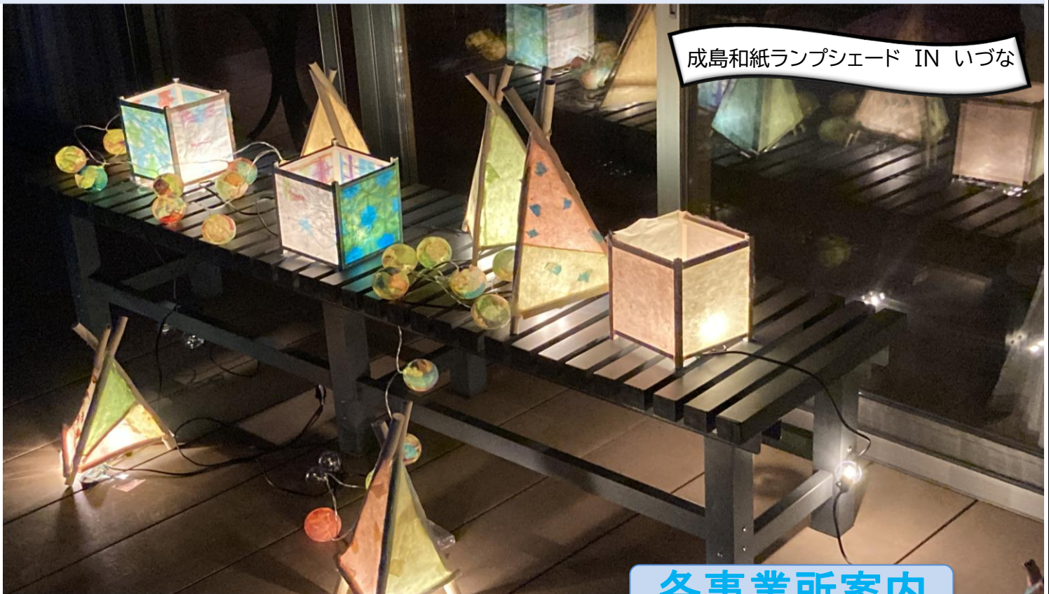
成島和紙ランプシェード IN いづな