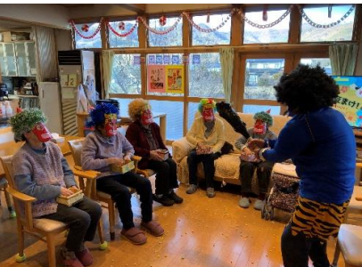
おりゃー・・・ あれ？みんなも鬼？