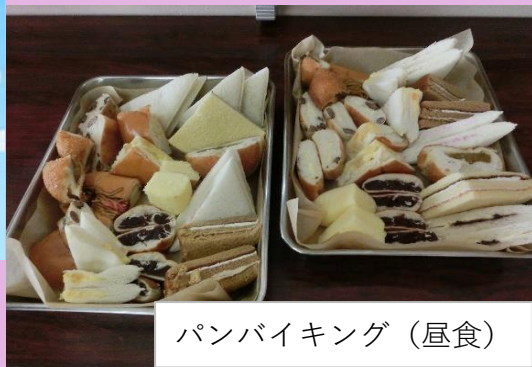
パンバイキング（昼食）